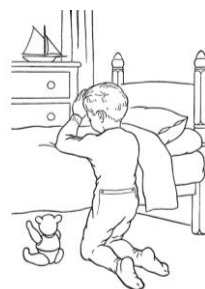
Knielen bij je bed