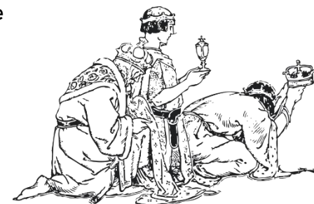
Knielende Magiërs bij de kribbe